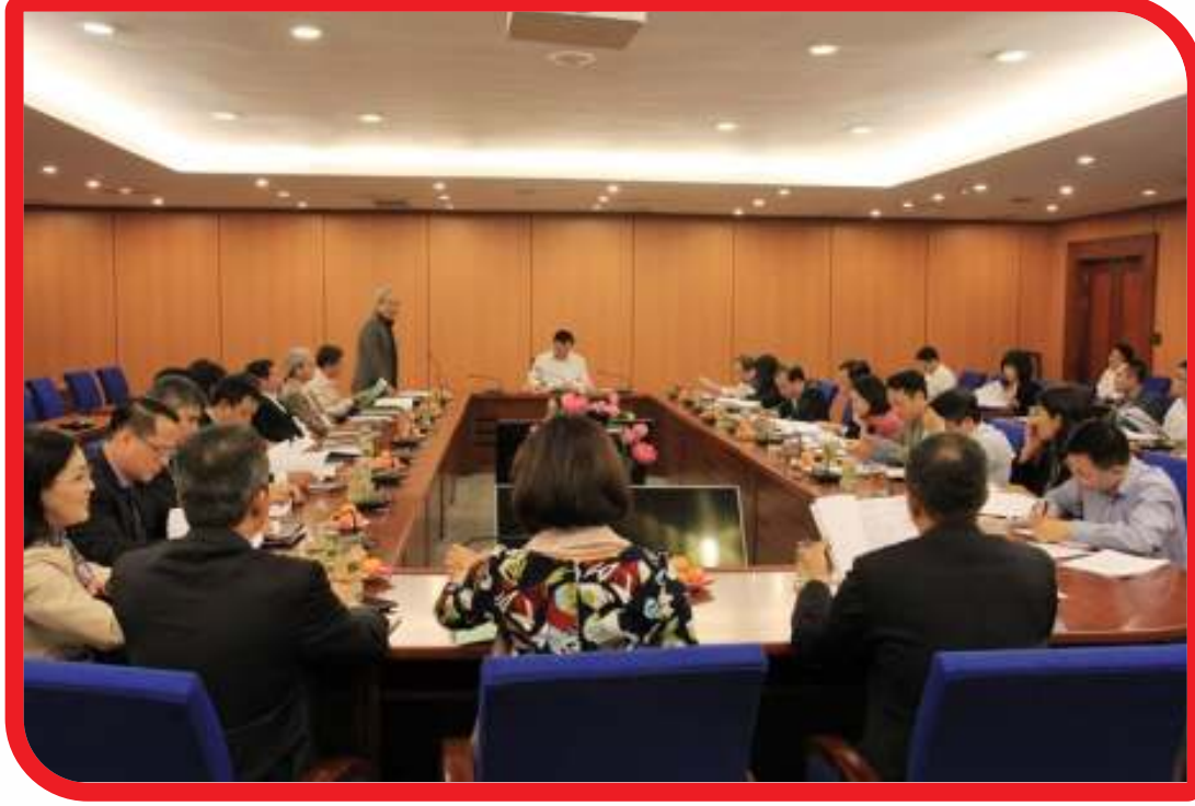
Toàn cảnh buổi làm việc với Bộ trưởng Bộ Tài chính