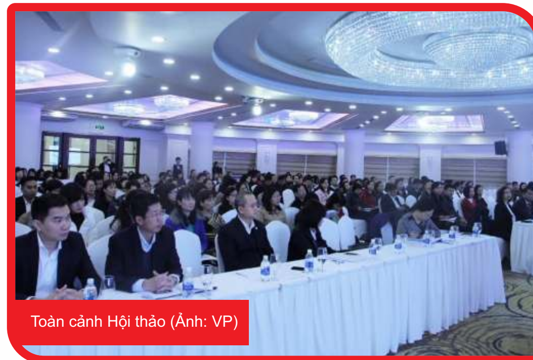
Toàn cảnh Hội thảo