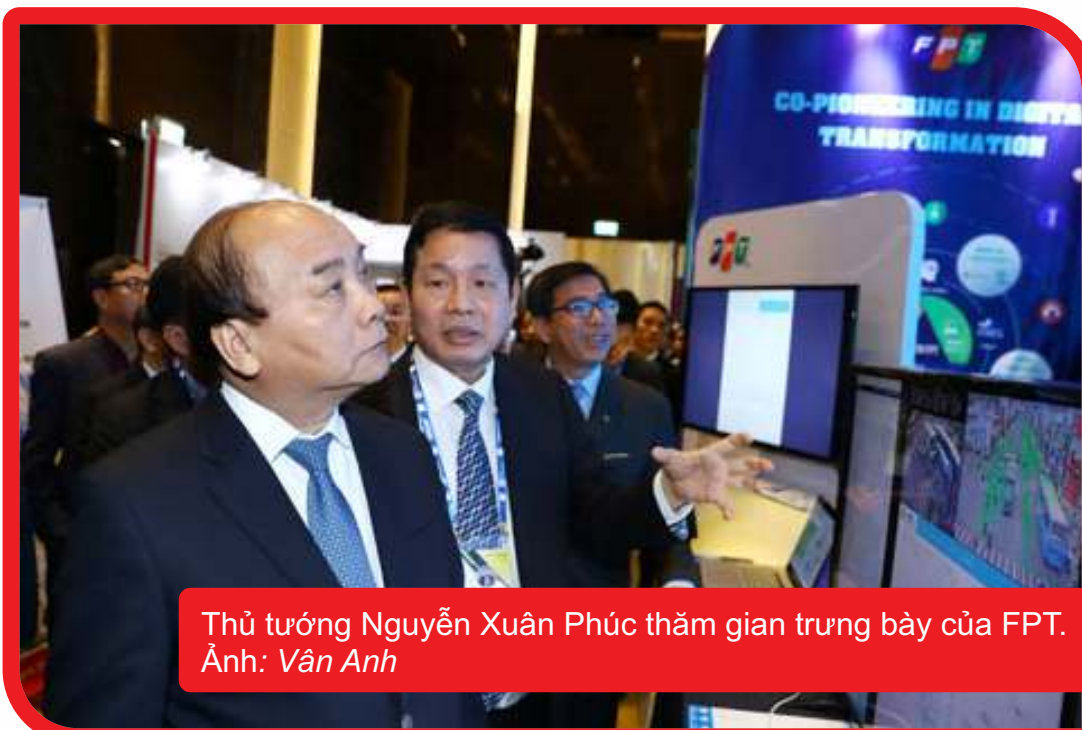
Thủ tướng Nguyễn Xuân Phúc tham gia trưng bày của FPT.

Thủ tướng yêu cầu làm rõ lợi thế của Việt Nam trong phát triển kinh tế số, nhất là nguồn nhân lực, sự năng động của kinh tế tư nhân.