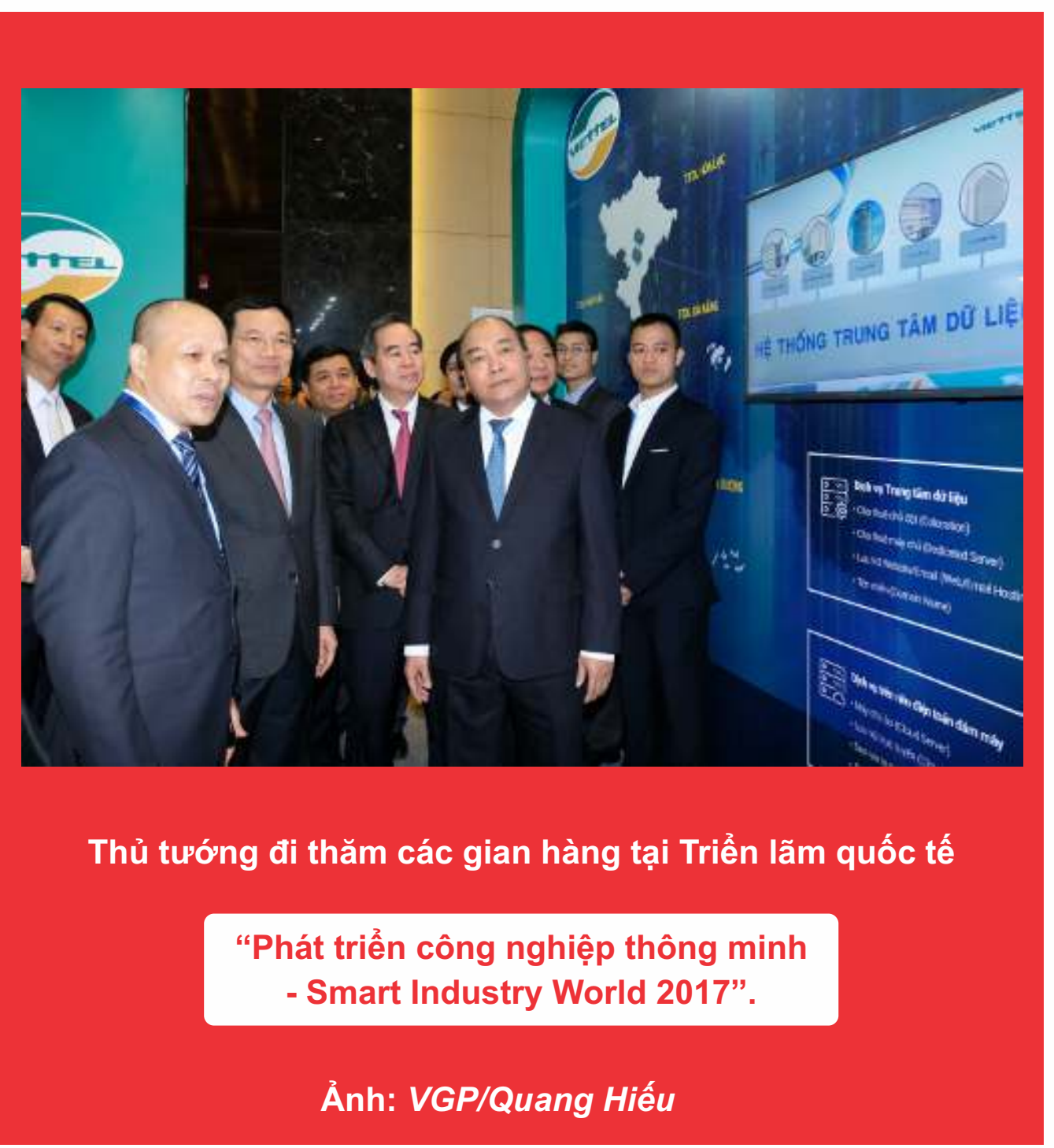
Thủ tướng đi thăm các gian hàng tại Triển lãm quốc tế