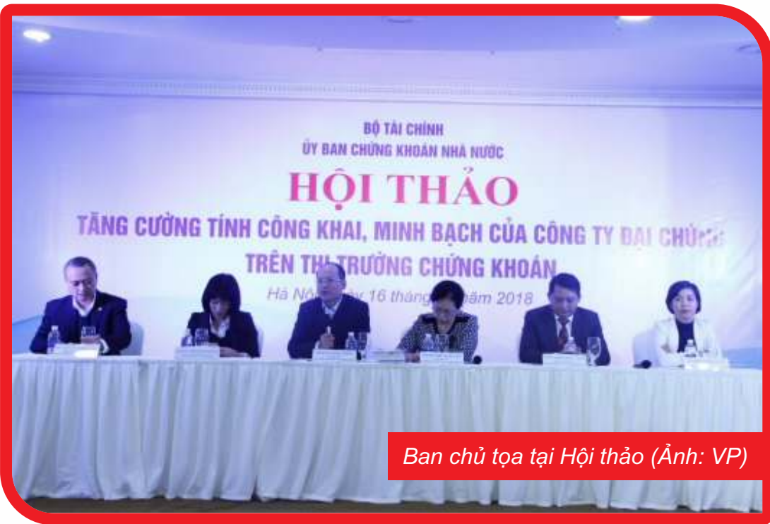
Ban chủ tọa tại Hội thảo

Công khai, minh bạch là những nguyên tắc hoạt động trên thị trường chứng khoán (TTCK), giúp thị trường hoạt động hiệu quả, tạo niềm tin cho các nhà đầu tư, từ đó thúc đẩy thị trường phát triển lành mạnh, an toàn và bền vững. Với quy mô TTCK hiện nay đạt trên 74% GDP, với gần 2.000 công ty đại chúng trong đó hơn 2/3 là tổ chức niêm yết/đăng ký giao dịch, hơn 100 tổ chức kinh doanh chứng khoán, 1,9 triệu tài khoản nhà đầu tư trong đó có nhiều nhà đầu tư nước ngoài, việc đảm bảo tính công khai, minh bạch về thông tin luôn là ưu tiên của cơ quan quản lý.